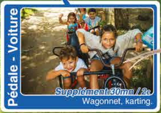
Pédale - Voiture