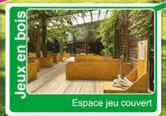
Jeux en bois